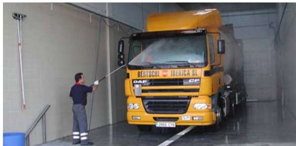
Limpeza exterior de un camión

encuentra una empresa especializada en este tipo de actividades.