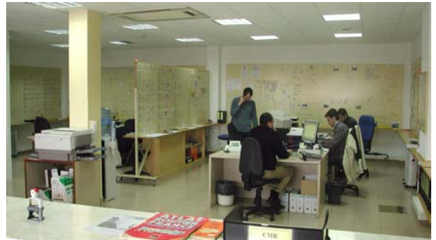
Centro de control de operaciones

Actualmente la plataforma de Bertschi Ibérica en Tarragona está estructurada en distintas zonas y áreas. Quizás la más importante sea el Centro de control de operaciones, desde el que se gestionan y controlan todas las salidas y llegadas de vehículos y convoyes ferroviarios. Los inmensos paneles de control están subdivididos en función de las distintas operaciones que Bertschi realiza, como la importación y exportación de contenedores y cisternas con Europa y los tráficos nacionales.