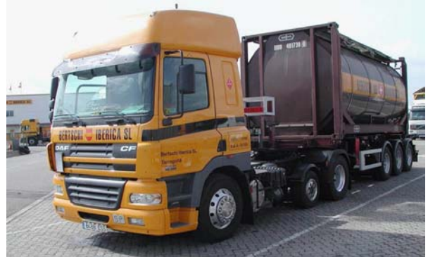
Zona de aparcamiento para camiones contigua a las instalaciones de Bertschi

Finalmente, también es importante destacar el área de aparcamiento para camiones que se encuentra a escasos metros de las instalaciones de Bertschi, y la terminal de contenedores y cisternas de Lavaflix que Bertschi utiliza como base.