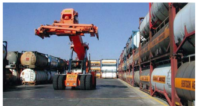
En Bertschi Ibérica se realizan cursos de formación continuada para todos los profesionales

A nivel formativo, Bertschi pone a disposición de todos sus chóferes un instructor técnico que de forma continuada organiza clases prácticas a través de las cuales el profesional mejora sus conocimientos y profundiza en el manejo de los equipos de transporte.