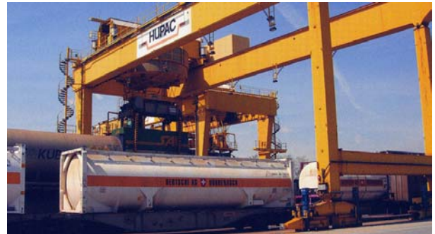
Bertschi realiza el 60% de sus tráficos por ferrocarril

Markus Widmer nos cuenta que la filosofía de esta empresa familiar suiza fundada en 1956 es ofrecer servicios de transporte internacionales e intermodales cien por cien comprometidos con la seguridad, la calidad y la protección del medio ambiente. Es por ello que, actualmente, el 60% de los transportes del grupo se realizan por ferrocarril, el 15% por vía marítima en líneas de short sea shipping, y sólo un 25% son servicios terrestres en camión.