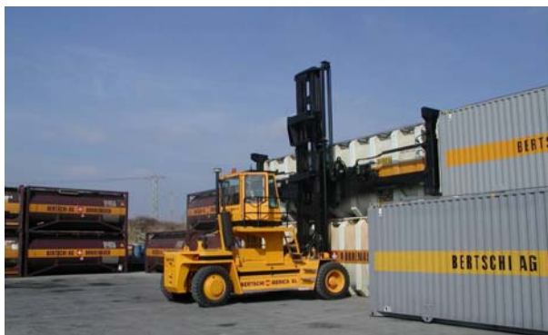
Instalaciones de Bertschi en Tarragona

Transcurridos diez años, en 2003, las instalaciones de Bertschi en Tarragona se amplían debido al aumento de la actividad y a la necesidad de dar más servicios externos e internos.