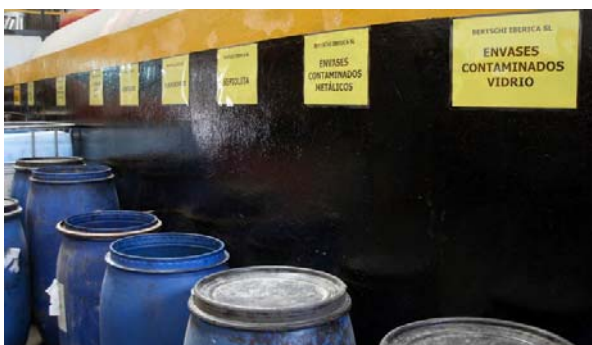
El reciclaje es importante en Bertschi Ibérica

La protección del medio ambiente es parte esencial de la filosofía empresarial de Bertschi. Por ello en la plataforma de Tarragona se ubica un almacén de recogida de residuos líquidos, como aceites y productos químicos, y sólidos, como pilas, baterías, vidrio, envases metálicos, etcétera.