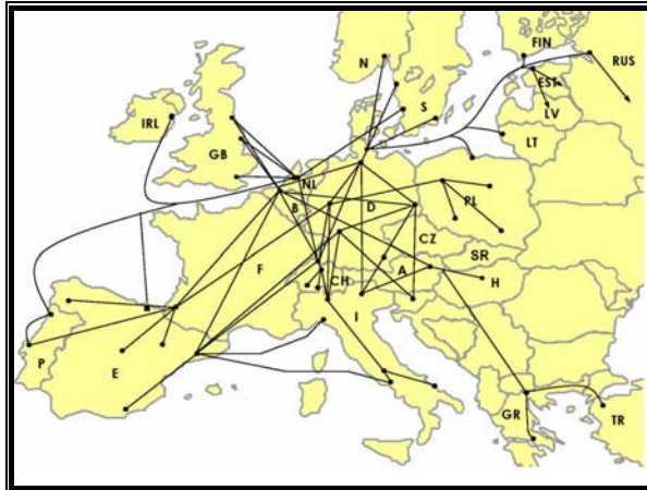
Red multimodal de Bertschi

Es por ello que en la actualidad la compañía tiene ubicados vehículos para el transporte (cisternas, cabezas tractoras y chasis portacontenedores) en Madrid, Zaragoza, Vitoria, Vigo, Baiona, Lisboa, Oporto, en lo que para Bertschi es la zona norte de la Península, y en Murcia, Valencia, Tarragona, Granollers (Barcelona) y Perpiñán, en la zona sur.