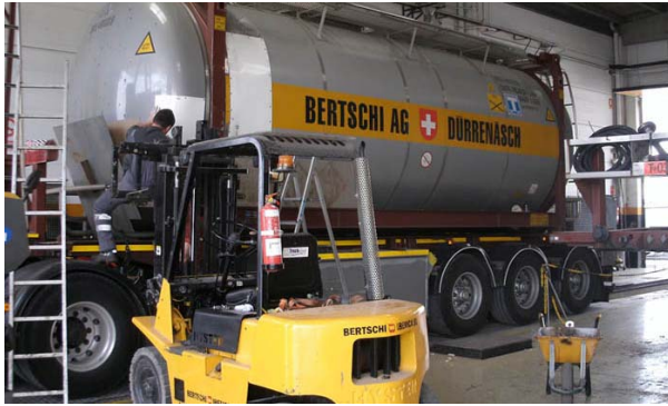
Reparando un contenedor cisterna