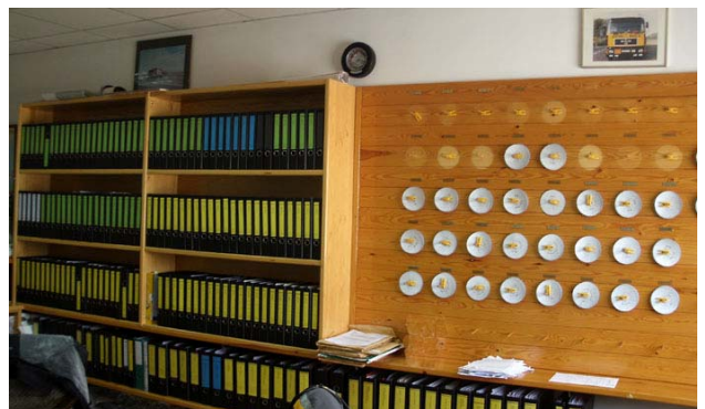
Detalle del Departamento técnico

También es esencial el trabajo que se desarrolla en el Departamento Técnico, desde el que se lleva un exhaustivo control del estado de todos los camiones.