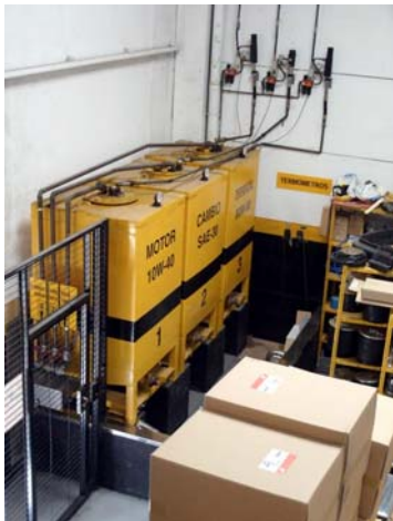
Depósitos de aceites y lubricantes

Por otro lado, la limpieza exterior de los vehículos es relevante para Bertschi, por ello también cuenta con un lavadero propio. En lo que se refiere al lavado de contenedores y cisternas, contigua a la plataforma de Bertschi, se