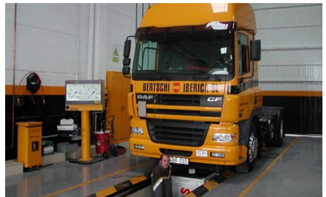
En el taller se comprueba el estado de los camiones

Bertschi dispone de un taller propio de reparaciones de camiones y contenedores, además de un almacén de piezas de recambio para todos los vehículos y depósitos de combustible, aceite y lubricantes de uso exclusivo para los camiones de la empresa.