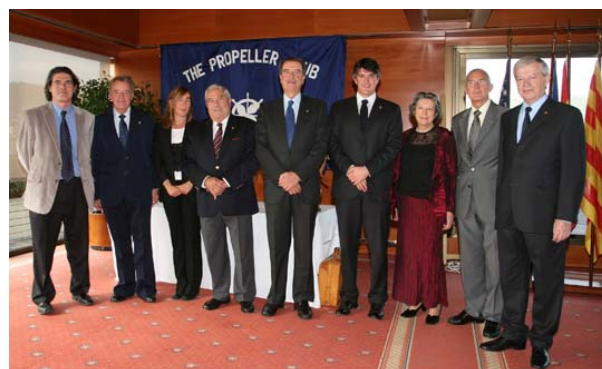
Miembros de la Junta del PC de Barcelona y de la EAPC