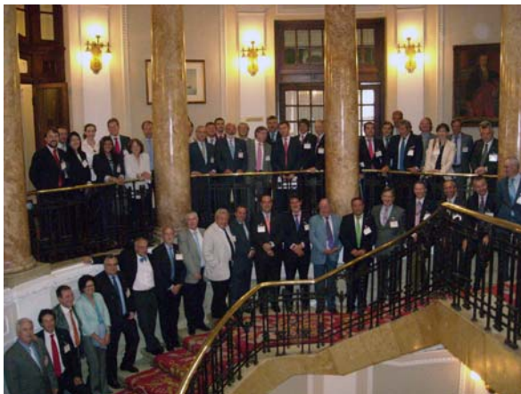
Foto de familia de los socios del Propeller Club del País Vasco-Puerto de Bilbao

El 20 de junio tuvo lugar en Bilbao el acto de constitución oficial del Propeller Club del País Vasco-Puerto de Bilbao.