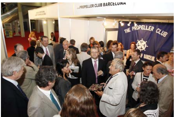
Instante del animado cóctel

La entidad, adscrita al Propeller Club de Estados Unidos con el número 227, cuenta ya con cerca de una treintena de socios, profesionales todos ellos de distintos ámbitos de actividad del transporte y la logística en Castellón.