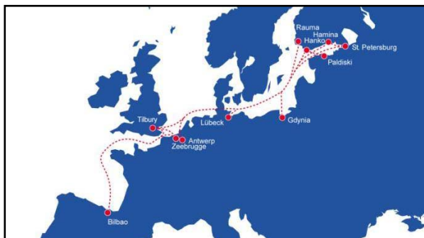
Mapa de los servicios ro-ro de Transfennica

Otra de las características de esta compañía es que todas las gestiones relacionadas con la operativa se realizan a través de sistemas EDI. Además, las terminales están tecnológicamente equipadas para ofrecer las máximas garantías de seguridad.