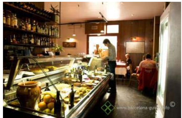
Les Delices de France Muntaner, 443 - 080021 - Barcelona Tel.: 93 201 94 69

Una recomendación: el codillo con choucroute, cuando lo hay, es delicioso.