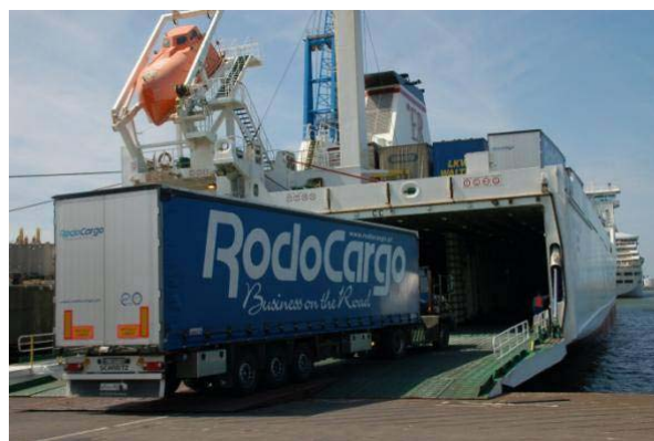
Transfennica transportó 3,5 millones de toneladas en 2009

Por lo que respecta a la flota para tráficados rodados, Transfennica opera 13 modernos buques ro-ro que permiten el transporte de trailers no acompañados, trailers frigoríficos, contenedores y cisternas, coches y otras unidades sobre ruedas o cadenas, además del transporte de mercancías peligrosas y transportes especiales de hasta 220 toneladas.