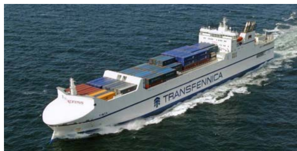
Transfennica dispone de 13 buques ro-ro

Al año siguiente, en 2006, Transfennica pone en marcha nuevos servicios ro-ro, concretamente con Gdynia (Polonia), con Husum, Rostock y Lübeck en Alemania, y con San Petesburgo (Rusia). En cada una de estas localidades, Transfennica abre oficinas propias, al igual que lo hace también en 2007 en Amsterdam, Bilbao y Zeebrugge. Finalmente, en 2008, Amsterdam pasa a ser la sede central de Transfennica Group.