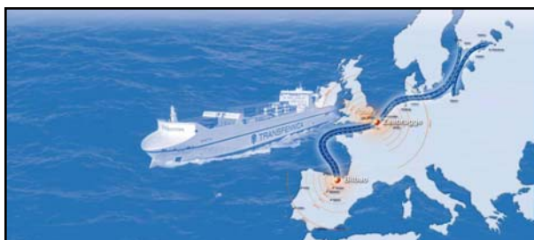
Transfennica enlaza Bilbao con Tilbury y Zeebrugge

Este servicio ha pasado en poco tiempo -desde septiembre de 2009 a mayo de 2010- de tres salidas semanales a cinco, gracias a la incorporación de un tercer buque en la ruta, es decir que el número de viajes ha aumentado en un 67%.