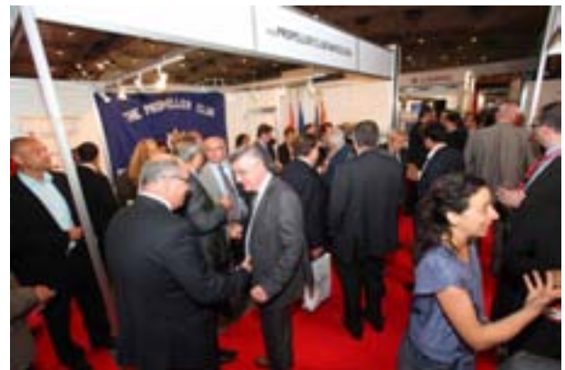
Un momento del concurrido cóctel del Propeller